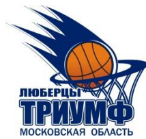
Дворец Спорта "Триумф" Московская область, г. Люберцы, улица Смирновская, дом 4