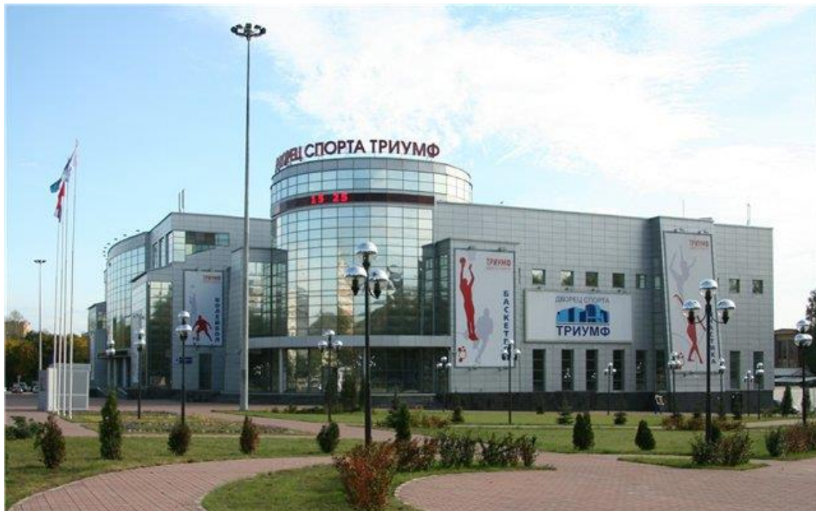
Вид спортивной арены Дворца Спорта "Триумф"